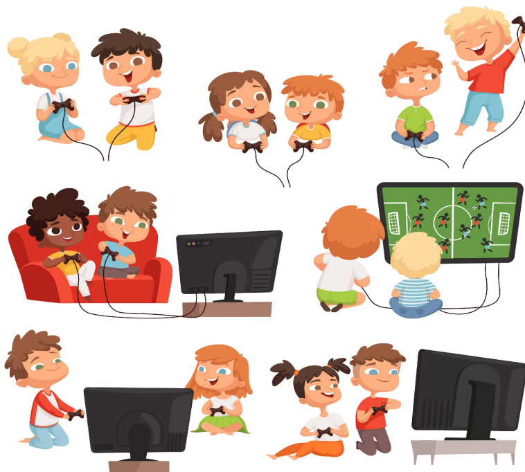
Figur 3.3 ...eller er skjerm og nett tross alt harmløst og nyttig for de fleste? Illustrasjon: ONYXprj/Shutterstock.

Jeg tror egentlig ikke helt på at livet på Bahnhof Zoom er så farlig. Ikke for de fleste av de som har det rimelig greit ellers. Og akkurat det tror jeg at de unge trenger å høre. Det er her dagens foreldre og lærere bør legge seg på en annen linje en 80-tallets avskrekking. Var det virkelig en god idé at foreldre og lærere fortalte barn at Å være ung er for jævlig ? Burde ikke heller foreldre, lærere, psykologer, sosiologer, sosionomer, journalister og medievitere fortelle sannheten, som er at skjerm er et litt dårligere, men ikke katastrofalt skadelig alternativ til den sosiale kontakten vi lengter etter? Bør vi ikke gi de unge en realistisk, faktabasert tro på at det kommer til å bli bra? Trenger ikke ungdom at de voksne er optimister?