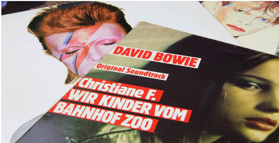
Figur 3.1 Glamorøse nederlag: Bowies Heroes og narkomane forstadsunger i Wir Kinder von Bahnhof Zoo.

Jeg husker godt da vi så filmen på 80-tallet. Hele klassen ble busset til kinoen, i et forsøk på å avskrekke oss fra å bli narkomane. Opplevelsen av filmen slo litt begge veier. Christiane F var utrolig pen, og livet på gata i Berlin hadde ved seg en samtidig forlokkende og skremmende blanding av glamour og død. Å brenne sterkt og kort, som et stjerneskudd i en mørk og kald verden, var ikke det et ganske fristende alternativ til å gløde langsomt frem til full opptjening av pensjonspoeng?