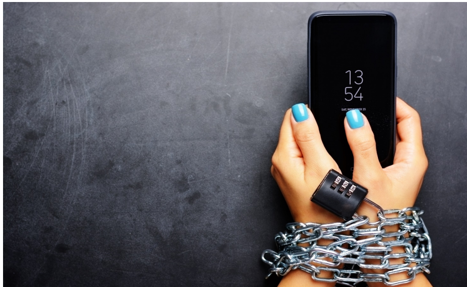
Figur 3.2 Frihet som fanger: Forlokkende grenseløshet kan gi stramme bindinger.

Jeg tror egentlig ikke helt på at livet på Bahnhof Zoom er så farlig. Ikke for de fleste av de som har det rimelig greit ellers. Og akkurat det tror jeg at de unge trenger å høre. Det er her dagens foreldre og lærere bør legge seg på en annen linje en 80-tallets avskrekking. Var det virkelig en god idé at foreldre og lærere fortalte barn at Å være ung er for jævlig ? Burde ikke heller foreldre, lærere, psykologer, sosiologer, sosionomer, journalister og medievitere fortelle sannheten, som er at skjerm er et litt dårligere, men ikke katastrofalt skadelig alternativ til den sosiale kontakten vi lengter etter? Bør vi ikke gi de unge en realistisk, faktabasert tro på at det kommer til å bli bra? Trenger ikke ungdom at de voksne er optimister?