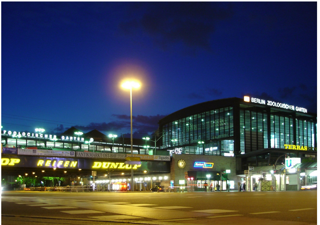
Bahnhof Zoo: Stasjon og helveteshøl. Illustrasjon fra Wikimedia.